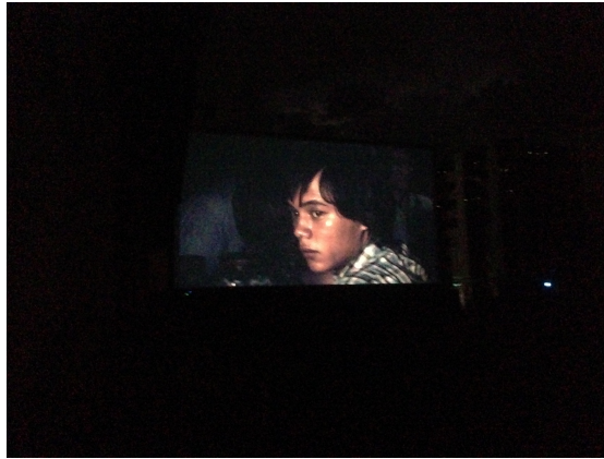
Extrait de: Maynila: Sa mga kuko ng liwanag , de Lino Brocka, 1975

De passage à Paris, je cherche en vain à manger philippin, le trend annoncé à New-York n'a pas encore franchi l'Atlantique. Internet recommande par contre un restaurant à Marseille, Palawan . Je me promets d'y aller à la première occasion, pourquoi ne pas y présenter le livre d'Annette Hug?